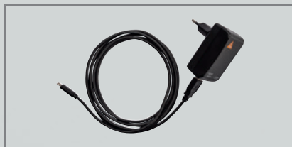
E4-USBC Steckernetzteil mit Kabel [04]