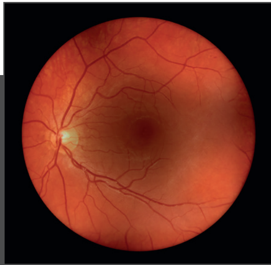
Sicht auf die Retina durch eine Katarakt mit visionBOOST*